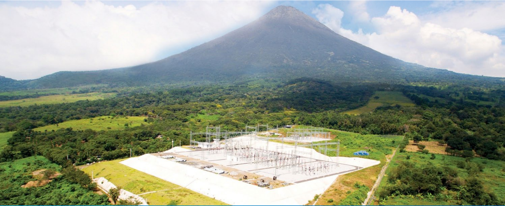
Subestación eléctrica Trecsa – Guatemala